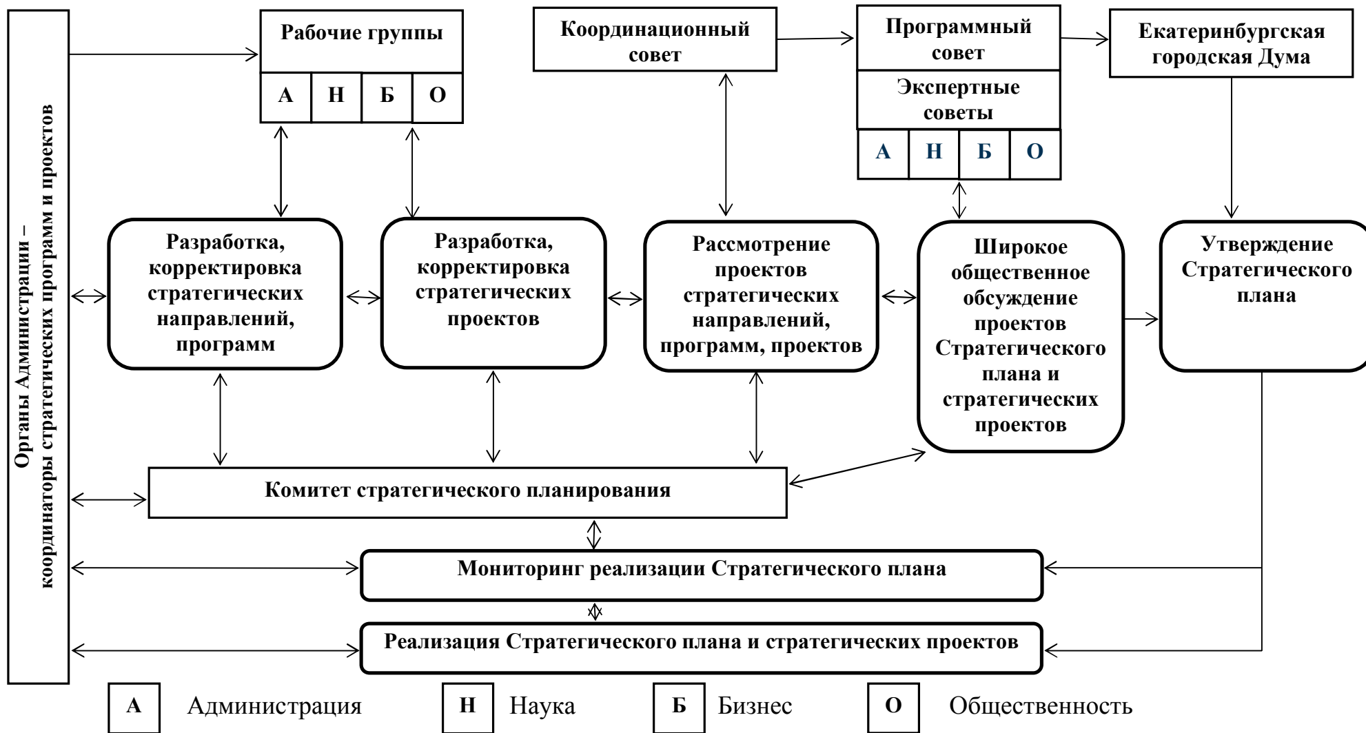
Схема организации процесса стратегического управления в муниципальном образовании «город Екатеринбург»