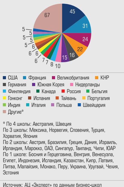
Количество школ – партнеров участников рейтинга

ле всерьез претендовать на глобальный рынок студентов, — встречные (когда студенты едут учиться в обе стороны) программы двух дипломов с ведущими школами мира. Сам факт такого тесного партнерства с ведущими игроками свидетельствует об уровне школы. В прошлом году программы двойного диплома имелись у 18 участников рейтинга, в этом году — у 23, в том числе у 18 — с партнерами, имеющими аккредитации «первого уровня». Лидер по этому параметру — ИБДА РАНХиГС.